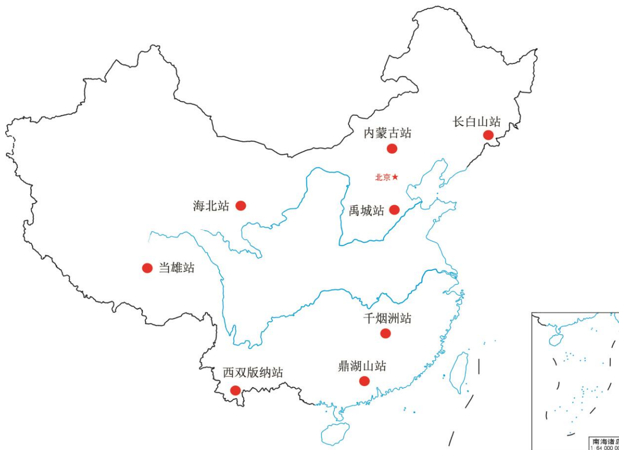
图 1 观测研究台站的空间分布 (审图号: GS (2018) 4935 号)